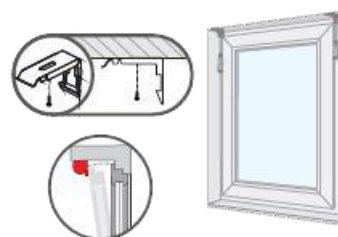
Afbeelding 1a (IN de dag)